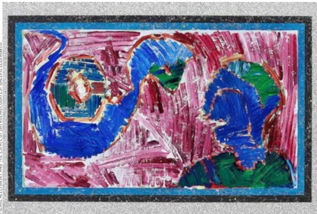
Pierre Alechinsky et Jiri Kolar, "Un calendrier réanimé – Avril", 1985-2013. Acrylique et collage sur bois, 80 x 120 cm.