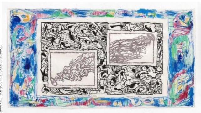
Ajout au Traité des excitants modernes , 2000. Eau-forte avec bordure à la tempera sur papier de Chine, 75 x 142 cm.

Il a beau flirter avec les 94 ans, Pierre Alechinsky ne repose pas un seul jour ses pinceaux, ses crayons.